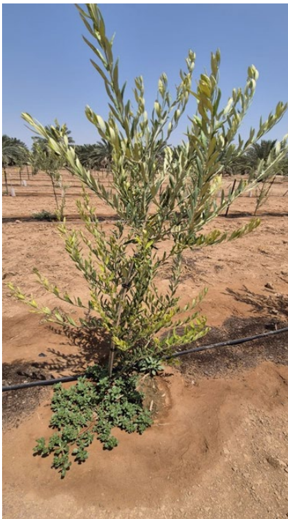
איור 2: שתיל ארבוזנה כמייצג לתופעת הצהבה נרחבת של העלווה, בעיקר בעלים הצעירים בקצות הצימוח. מו"פ בקעת הירדן, 2025.

* הנתונים מוצגים כממוצע כללי לכל זן, לאחר שקילה וחלוקה במספר העצים, ללא ניתוח סטטיסטי.